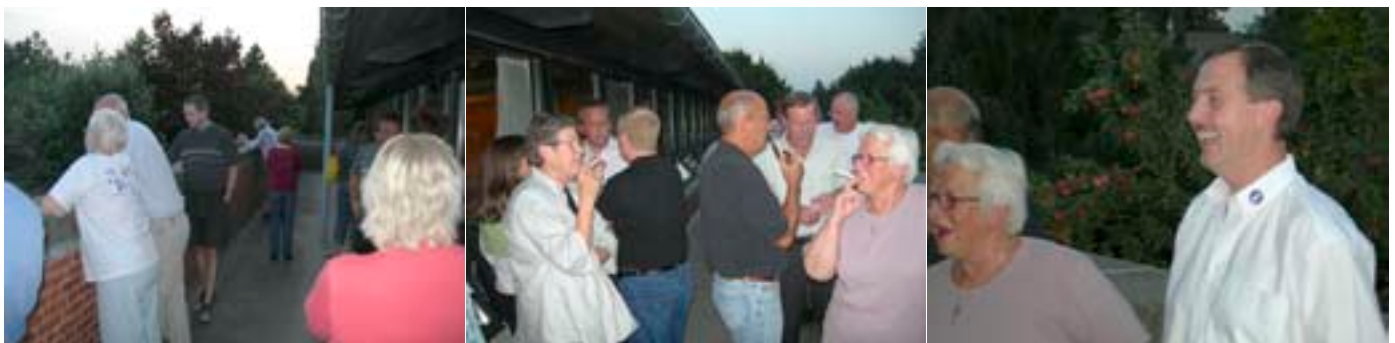
RYGEPAUSE UNDER FÆLLESMØDET. DET BLEV EN LANG AFTEN MED MANGE SPØRGSMÅL. OM FÅ DAGE SKAL DU SELV TAGE STILLING TIL VEJLBYNET.