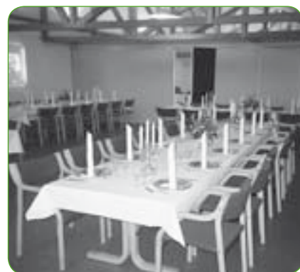
Kildehøjen nr. 8 (A – til 60 personer)