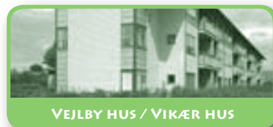
VEJLBY HUS / VIKÆR HUS

– Vejlbyboere på Safari - midt i Danmark