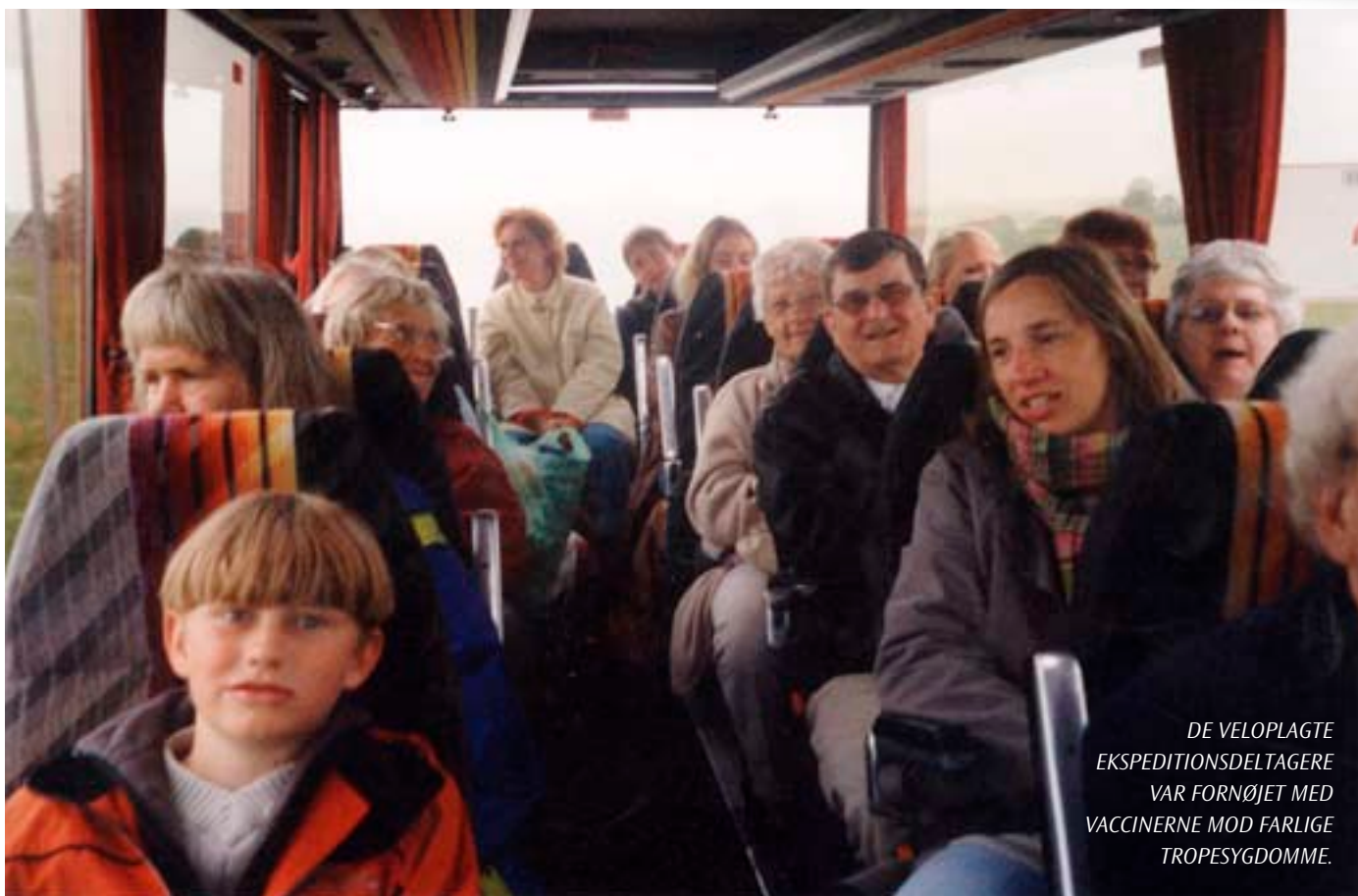
DE VELOPLAGTE EKSPEDITIONSDELTAGERE VAR FORNØJET MED VACCINERNE MOD FARLIGE TROPEPSYGDOMME.