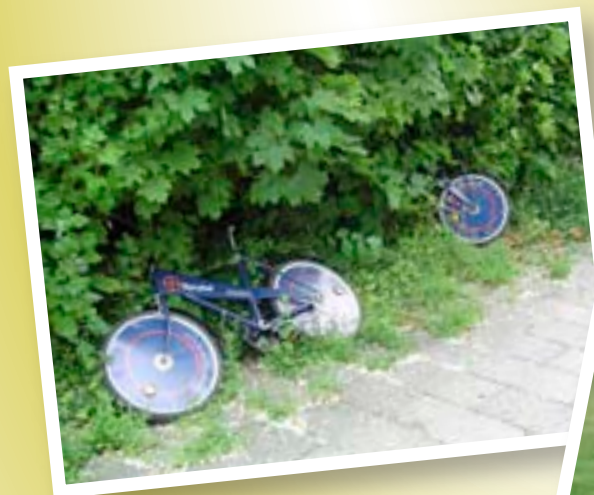
BYCYKLER PÅ AFVEJE