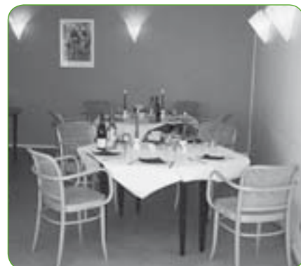
Et hjørne af kaffestuen på Langengevej