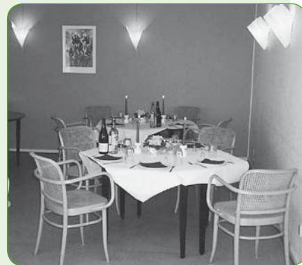
Et hjørne af kaffestuen på Langengevej