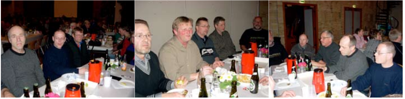
BOLIGFORENINGENS ANSATTE VAR MØDT TALSTÆRKT OP TIL GENERALFORSAMLINGEN, OG DE FIK EN FORTJENT ANERKENDELSE FRA FORSAMLINGEN.

beboerne først skal godkende projektet på et ekstraordinært afdelingsmøde, hvor beboernes beslutning om stor/lille huslejev forhøjelse vil have en indflydelse på hvor meget renovering der skal gøres. – I skrivende stund har jeg læst at Landsbyggefonden har bevilget penge til renovering af Vejlbj Vænge i 2009-10 og af Vejlbj Toften i 2011-12 (samtidig med bevillingerne til øvrige renoveringer i Århus området, bl.a. Gellerup).