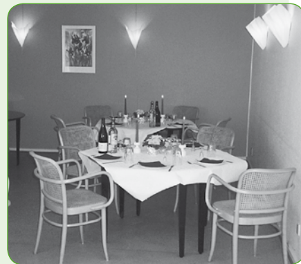
Et hjørne af kaffestuen på Langengevej