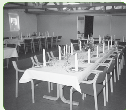
Kildehøjen nr. 8 (A – til 60 personer)