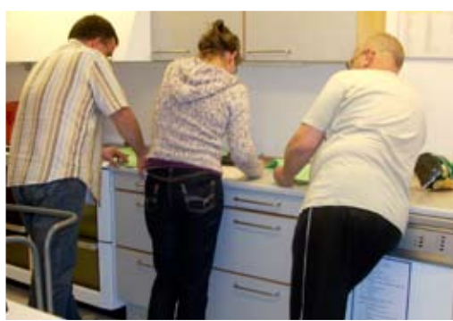
STEMMEUDVALGET TOG KØKKENET I BRUG, OG EFTER ET KONCENTRERET TÆLLEARBEJDE VAR DEN NYE BESTYRELSE VALGT.