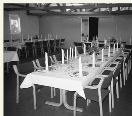
Kildehøjen nr. 8 (A – til 60 personer)