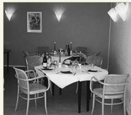
Et hjørne af kaffestuen på Langengevej