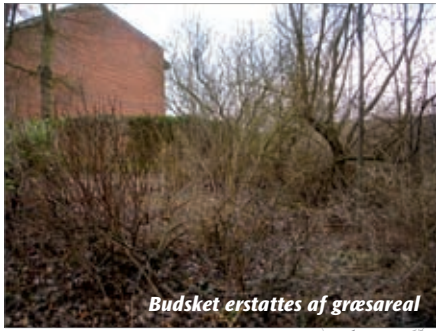
Budsket erstattes af græsareal