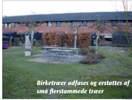
Birketræer udfases og erstattes af små flerstammede træer