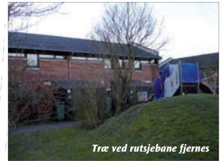
Træ ved rutsjebane fjernes