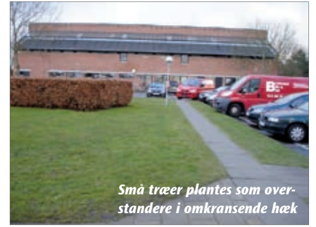
Små træer plantes som overstandere i omkransende hæk