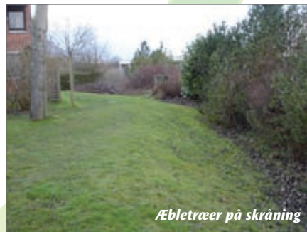
Æbletræer på skråning