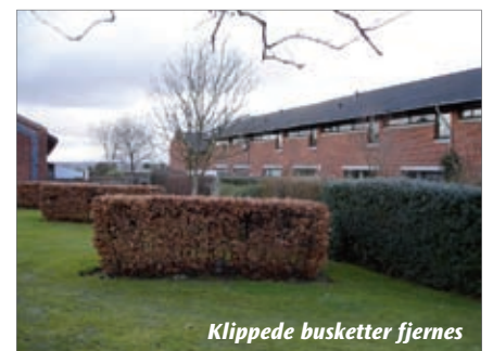
Klippede busketter fjernes

- Det handler bare om at kanalisere pengene de rigtige steder hen, så beboerne får størst udbytte, forklarer hun og fortsætter: