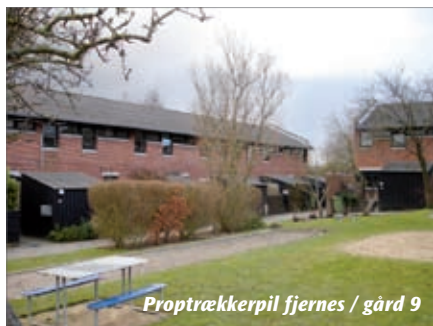
Proptrækkerpil fjernes / gård 9