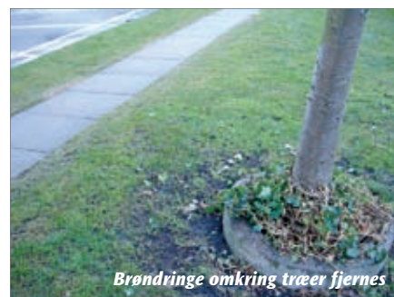
Brødringe omkring træer fjernes