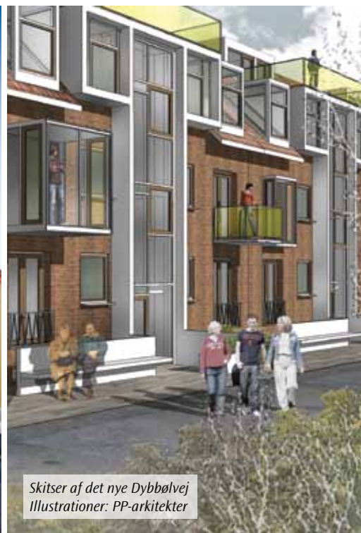
Skitser af det nye Dybbølvej Illustrationer: PP-arkitekter